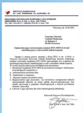
Opinia Instytutu Kardiologii