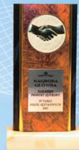
Nagroda IV Targów Szkół Językowych