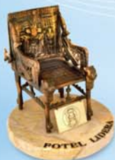
Nagroda FOLTEL LIDERA przyznawana najlepszym przedsiębiorcy na Mazowszu po raz trzeci przypadła w udziale firmie SITA 2009, 2010 i 2011 r.