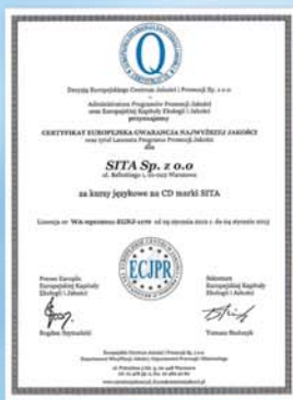
Europejska Gwarancja Najwyższej Jakości