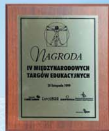
Nagroda IV Międzynarodowych Targów Edukacyjnych