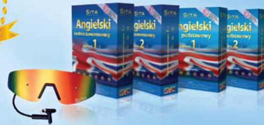
Zestaw do nauki języka angielskiego