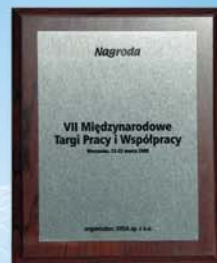
Nagroda VII Międzynarodowych Targów Pracy i Współpracy